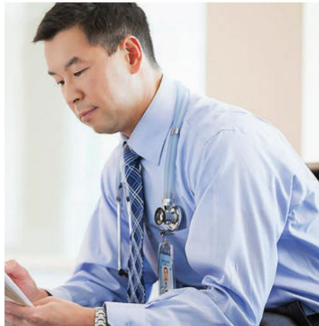
EnvisionIT Healthcare: 의료 응용 분야에서 입증된 전문성.

bizhub 364e 시리즈는 사례 파일을 관리하고 ECM 또는 eDiscovery 제공을 위한 정보를 준비하기 위한 업계 표준 소프트웨어와의 완벽한 인터페이스를 제공합니다. Konica Minolta의 자체 Dispatcher Phoenix Legal 소프트웨어는 Bates Stamping, 교정 및 PDF/A 변환과 같은 프로세스를 간소화하는 데 도움이 됩니다. 우리는 미국에 있는 5,000개 이상의 로펌의 신뢰할 수 있는 공급자로서 비용을 통제하고 변호사-고객의 기밀을 보호하는 문서 관리 및 클라우드 기반 솔루션을 통해 문서 및 IT 관리 요구 사항을 제공합니다.