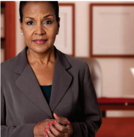
EnvisionIT Legal: 더 높은 생산성을 위해 케이스 로드를 처리합니다.

업무량이 증가하는 법률 서비스 제공자는 문서를 처리하고, 검색 가능한 텍스트 파일을 생성하고, Bates 스탬핑, 주석, 편집 및 기타 필수 작업을 수행하고, 변호사가 모바일 장치를 통해 사건 파일에 액세스할 수 있는 새로운 방법이 필요합니다. 코니카 미놀타가 모든 것을 해냅니다.